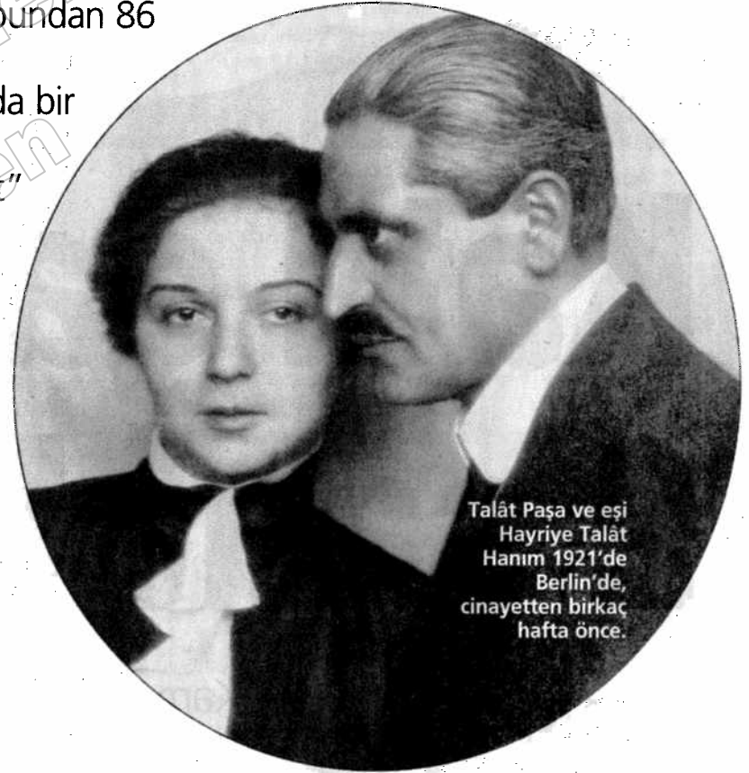
Talât Paşa ve eşi Hayriye Talât Hanım 1921'de Berlin'de, cinayetten birkaç hafta önce.

Talât Paşa, Birinci Dünya Savaşı yıllarındaki sadrazamlığı sırasında, Almanya'dan getirilen bir tabancayı deniyor.